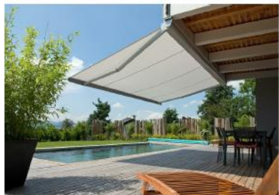
referenčni primer tende

Senčenje teras stanovanj v naselju Nokturno je dovoljeno s tendami in senčniki bele barve. Namestitev tende je dovoljena izključno pod stropom nadkritega dela teras. Namestitev tende na čelo fasade ni dopustna.